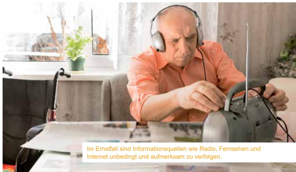
Im Ernstfall sind Informationsquellen wie Radio, Fernsehen und Internet unbedingt und aufmerksam zu verfolgen.

Zudem ist darauf zu achten, dass man für alle Jahreszeiten gerüstet ist, man weiß nicht, wann man auf seine Vorräte zurückgreifen muss. Auch wenn es