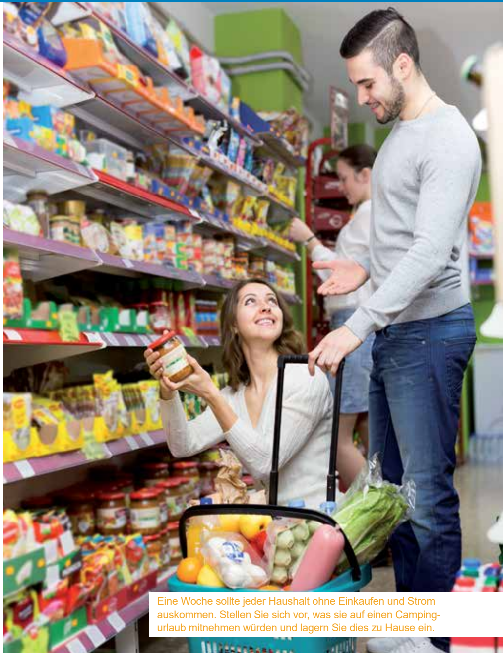
Eine Woche sollte jeder Haushalt ohne Einkaufen und Strom auskommen. Stellen Sie sich vor, was sie auf einen Camping- urlaub mitnehmen würden und lagern Sie dies zu Hause ein.

Da man im Fall der Fälle, zum Beispiel bei einem Hochwasser, auch mit einer Evakuierung rechnen sollte, ist es ratsam alle wichtigen Dokumente immer griff- bereit zu haben. Im Idealfall hat man die persönliche Dokumentenmappe auch weitgehend wasserdicht verpackt. Sollte man nicht mehr rechtzeitig seine Doku- mente sichern können, bleiben nämlich Geburts- oder Besitzurkunden trotz Hochwasser erhalten. Gerade für Haushalte, die von Hochwasser ge- fährdet sind, aber auch bei einfachen Wasserrohrbrüchen, sind Wasser- schuttsäcke zu empfehlen. Sie können aber nicht nur vor Wasser-einbruch schützen, sondern auch rund 20 Liter Wasser aufnehmen und sind deshalb