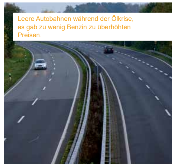
Leere Autobahnen während der Ölkrise, es gab zu wenig Benzin zu überhöhten Preisen.

All diese Beispiele zeigen uns, dass Hamsterkäufe ein massenpsychologisches Phänomen sind, die negative Entwicklungen zusätzlich beschleunigen können. Nur rechtzeitige und wohl überlegte Vorbereitung garantiert im Fall der Fälle Unabhängigkeit.