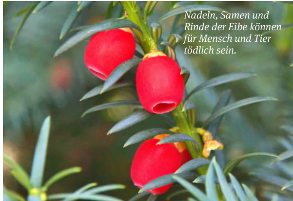
Nadeln, Samen und Rinde der Eibe können für Mensch und Tier tödlich sein.

So schön manche Pflanzen auch blühen, so prächtig sich ihre Blätter verfärben, so leuchtend und einladend ihre Früchte sind: Erstaunlich viele Pflanzen in unseren Wohnzimmern, Gärten, Parks und in der freien Natur sind giftig. Dies ist vor allem im Zusammenhang mit Kindern wichtig zu wissen, da diese die Welt auch über ihren Geschmackssinn entdecken und Giftpflanzen und giftige Beeren noch nicht von ungiftigen unterscheiden können. Giftige Zimmerpflanzen können übrigens auch für Haustiere gefährlich sein. Diese Broschüre soll auf die Gefahr von Giftpflanzen aufmerksam machen und helfen, Vergiftungen zu vermeiden.