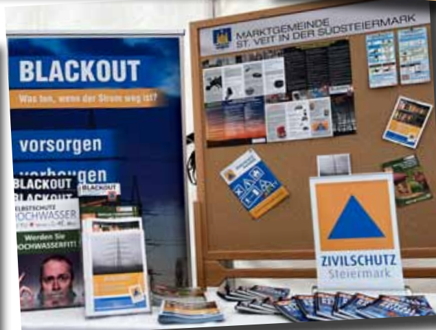
St. Nikolai ob Draßling