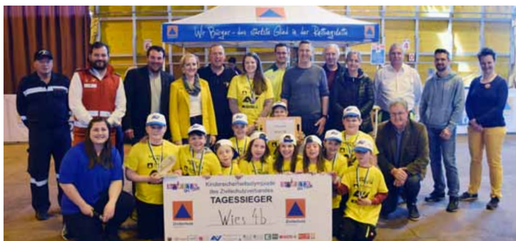
Leibnitz 2: Siegerklasse: VS Wies, 4b Veranstaltungsort: Sulmtalhalle Pistorf Termin: 25. April 2023 TeilnehmerInnen: 13 Schulklassen mit 210 SchülerInnen