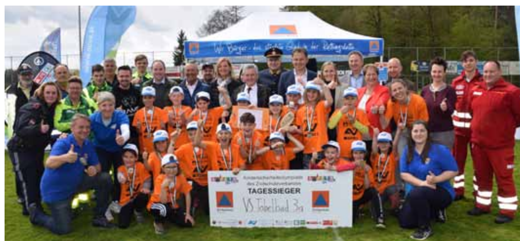
Deutschlandsberg: Siegerklasse: VS Tobelbad, 3a Veranstaltungsort: Sportplatz Preding Termin: 26. April 2023 TeilnehmerInnen: 14 Schulklassen mit 277 SchülerInnen