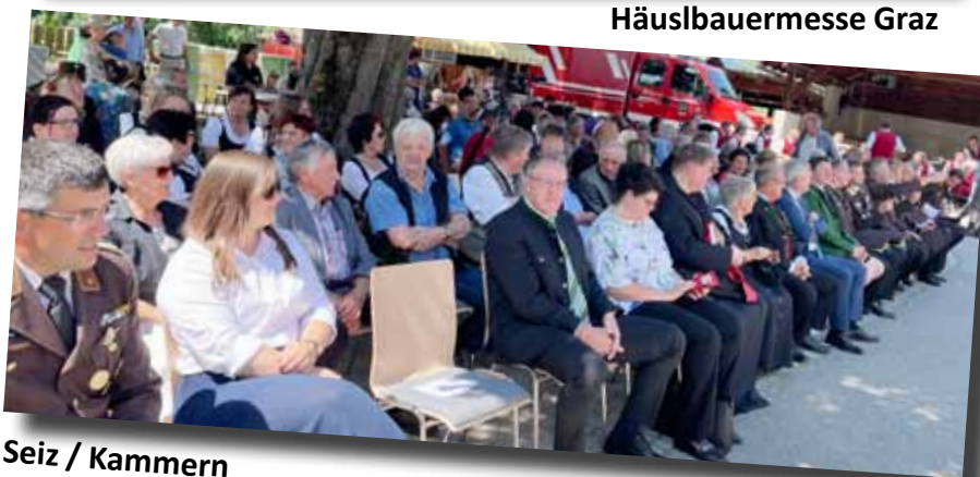
Seiz / Kammern