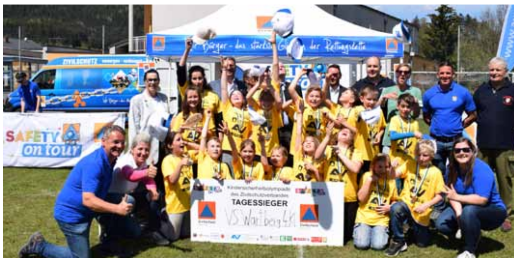
Bruck-Mürzzuschlag 2: Siegerklasse: VS Wartberg, 4. Kl. Veranstaltungsort: Mittelsch. St. Barbara Termin: 5. Mai 2023 TeilnehmerInnen: 12 Schulklassen mit 214 SchülerInnen