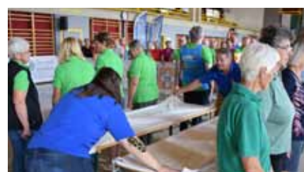
Senioren-sicherheitsolympiade 2023 Bezirk Liezen Grimminghalle Bad Mitterndorf 13. September 2023