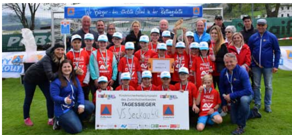
Murtal: Siegerklasse: VS Seckau, 4. Kl. Veranstaltungsort: Zirbenlandstadion Obdach Termin: 9. Mai 2023 TeilnehmerInnen: 17 Schulklassen mit 300 SchülerInnen