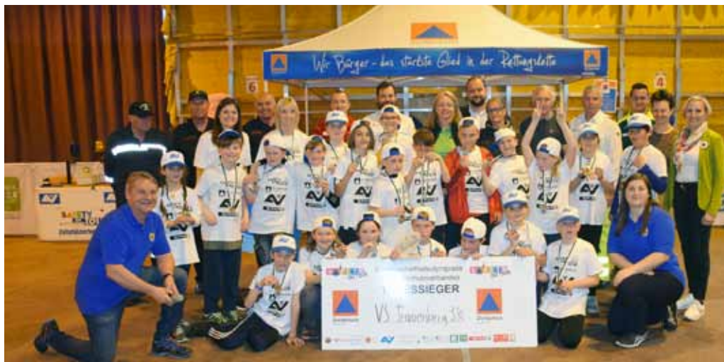
Leibnitz 1: Siegerklasse: VS Frauenberg, 3. Kl. Veranstaltungsort: Sulmtalhalle Pistorf Termin: 24. April 2023 TeilnehmerInnen: 10 Schulklassen mit 171 SchülerInnen