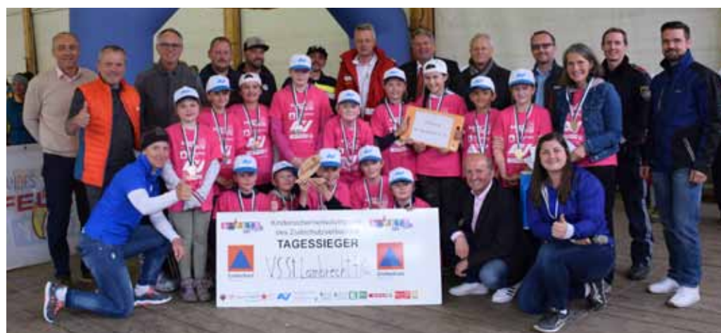
Murau: Siegerklasse: VS St. Lambrecht, 4. Kl. Veranstaltungsort: Halle St. Lambrecht Termin: 10. Mai 2023 TeilnehmerInnen: 18 Schulklassen mit 307 SchülerInnen