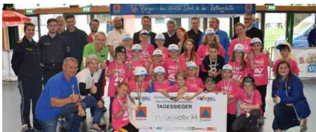
Liezen: Siegerklasse: VS Gaishorn, 3./4. Kl. Veranstaltungsort: Ennstalhalle Liezen Termin: 11. Mai 2023 TeilnehmerInnen: 20 Schulklassen mit 338 SchülerInnen