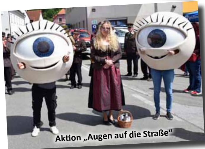
Aktion „Augen auf die Straße“