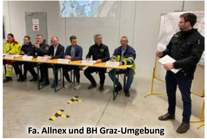
Fa. Allnex und BH Graz-Umgebung

Stabsübungen einem zentralen Ziel: dem Schutz der Bevölkerung. Gut vorbereitete Gemeinden und eine handlungssichere Bezirkshauptmannschaft tragen wesentlich dazu bei, Schäden zu begrenzen, Menschen rechtzeitig zu informieren und die öffentliche Ordnung auch in Ausnahmesituationen aufrechtzuerhalten. Stabsübungen sind daher kein theoretischer Aufwand, sondern eine unverzichtbare Investition in Sicherheit, Krisenfestigkeit und verantwortungsvolles Verwaltungshandeln.