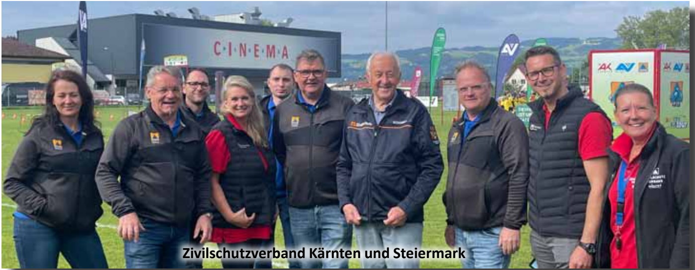
Zivilschutzverband Kärnten und Steiermark