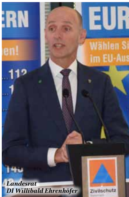
Landesrat DI Willibald Ehrenhöfer