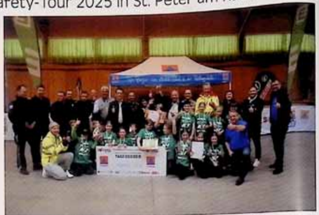
Die diesjährigen Gewinner von der Volksschule Krakau.