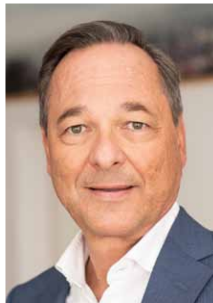
HR Mag. Harald Eitner, Leiter der Fachabteilung Katastrophenschutz und Landesverteidigung des Landes Steiermark

In diesem Sinne wünsche ich dem Steirischen Zivilschutzverband für das kommende Jahr in unser aller Interesse eine erfolgreiche Vortrags-, Informations- und Schulungstätigkeit, damit wir