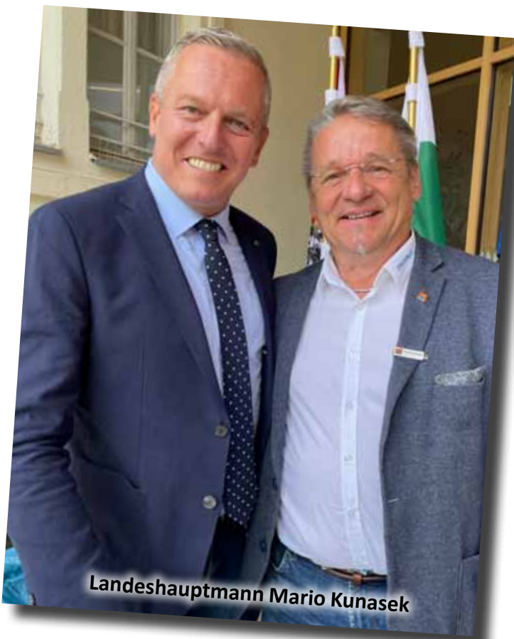
Landeshauptmann Mario Kunasek