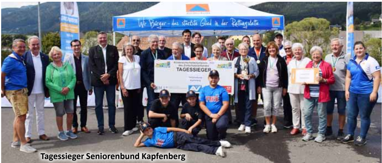
Tagessieger Seniorenbund Kapfenberg