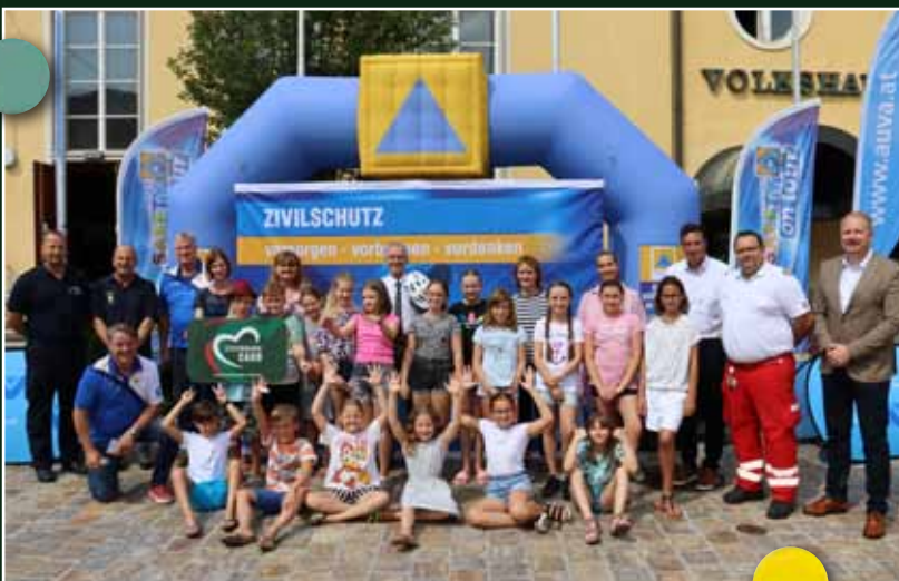
Siegerklasse VS Mariahof

Dem Zivilschutzverband Steiermark ist etwas Sensationelles gelungen. Beim Projekt „Safety goes to school“ machten sieben Bundesländer mit! Heuer gab es eine neu überarbeitete Sicherheitsbox.