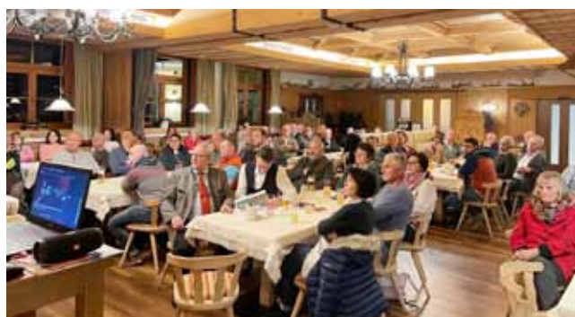
Blackout-Vortrag in Aich