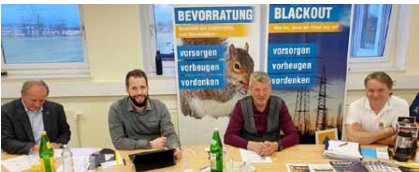
Beratung in Gössendorf

2022 wurden rund 300 Vorträge abgehalten. Außerdem wurden an die 100 Gemeinden intensiv zum Thema Blackout betreut.