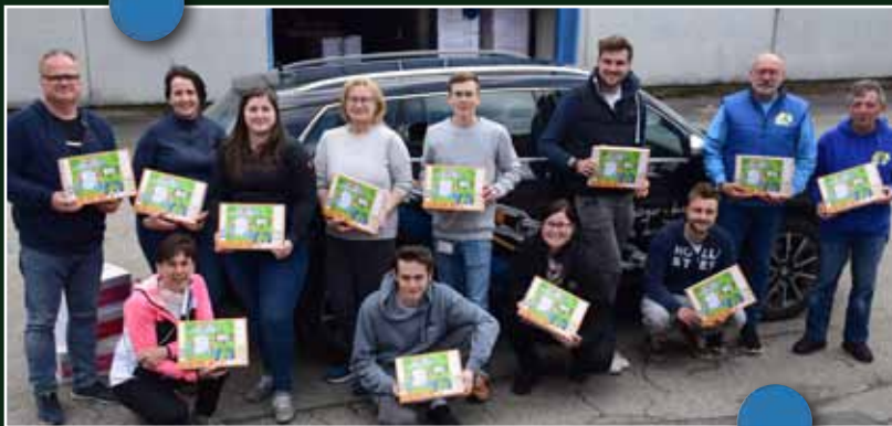
Das fleißige ZSV-Team