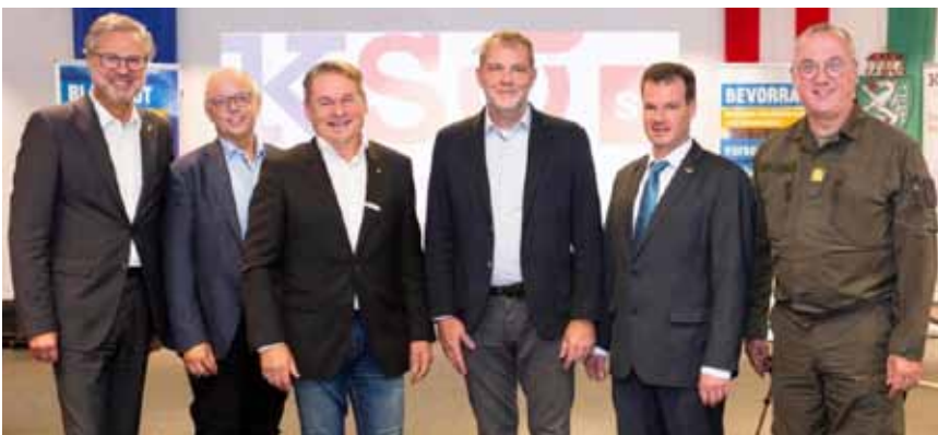
Wirtschaftskammer und Kompetenzzentrum Sicheres Österreich