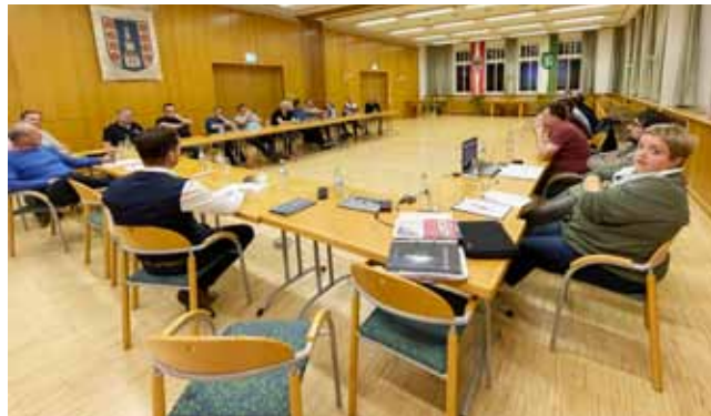
Beratung in Pischelsdorf