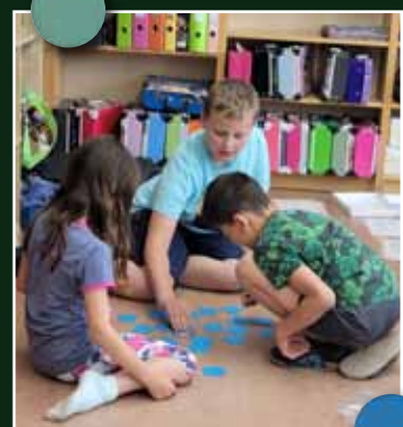
VS St. Marein bei Graz