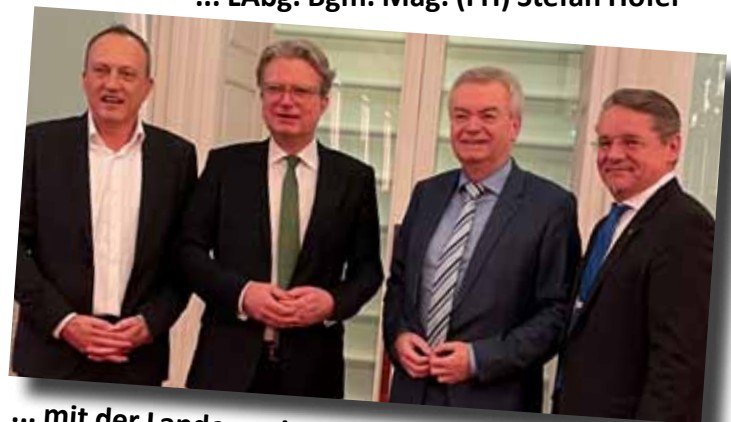
... mit der Landesregierungsspitze