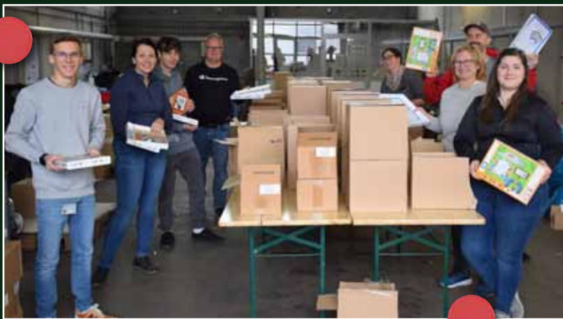
Alle Spielboxen wurden händisch verpackt.