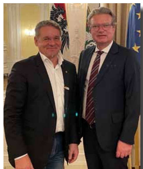
... mit LH Mag. Christopher Drexler