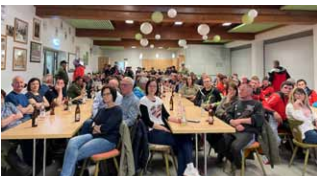
Blackout-Abend in Krakau